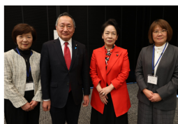
山田 宏参議院議員と比嘉奈津美参議院議員