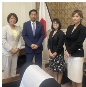
関口昌一参議院議員