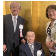
(左) 日本歯科医師会 高橋英登会長 (中央) 日本歯科医師連盟 太田謙司会長 (右) 日本歯科衛生士連盟 澤千秋会長